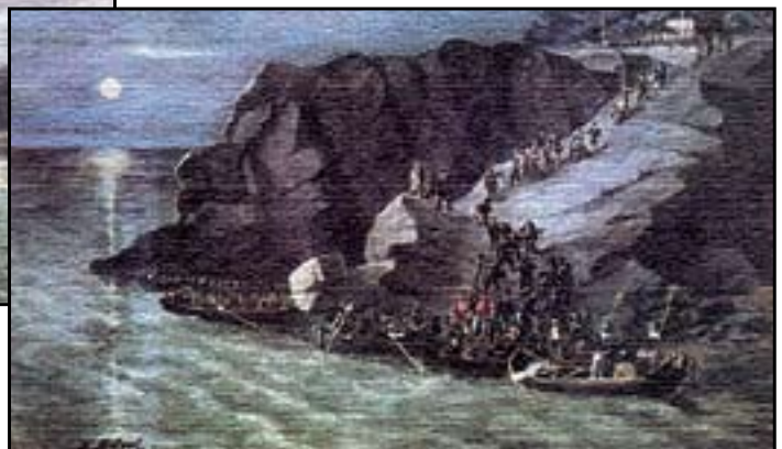
L'impresa dei Mille è stata celebrata da numerosi dipinti, talvolta ispirati dalla fantasia dell'artista, come avvenuto in questi due oli su tela del 1860, del pittore G. Nodali, conservati presso il Museo Civica di Brescia